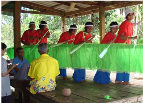
ภาพที่ 2 เยาวชนรุ่นใหม่..ผู้รับการถ่ายทอดเพลงเรือ

ขับร้องเพลงเรือได้เป็นอย่างดี จนปัจจุบันกลุ่มนักเรียนที่ผ่านการฝึกขับร้องเพลงเรือสามารถขับร้องเพลงเรือในงานโรงเรียนหรือกิจกรรมต่างๆ ในชุมชน เพื่อเป็นการเผยแพร่ให้กลุ่มคนทั่วไปซึ่งถือเป็นคนรุ่นใหม่ๆ ได้เห็นและสัมผัสถึงการละเล่นพื้นบ้านที่มีการสืบทอดมาจากบรรพบุรุษ และได้รับประโยชน์ในแง่ของความรู้ แง่คิดต่างๆ ที่ปรากฏและสอดแทรกอยู่ในบทกลอน ซึ่งสามารถนำไปปรับใช้ในชีวิตประจำวันได้